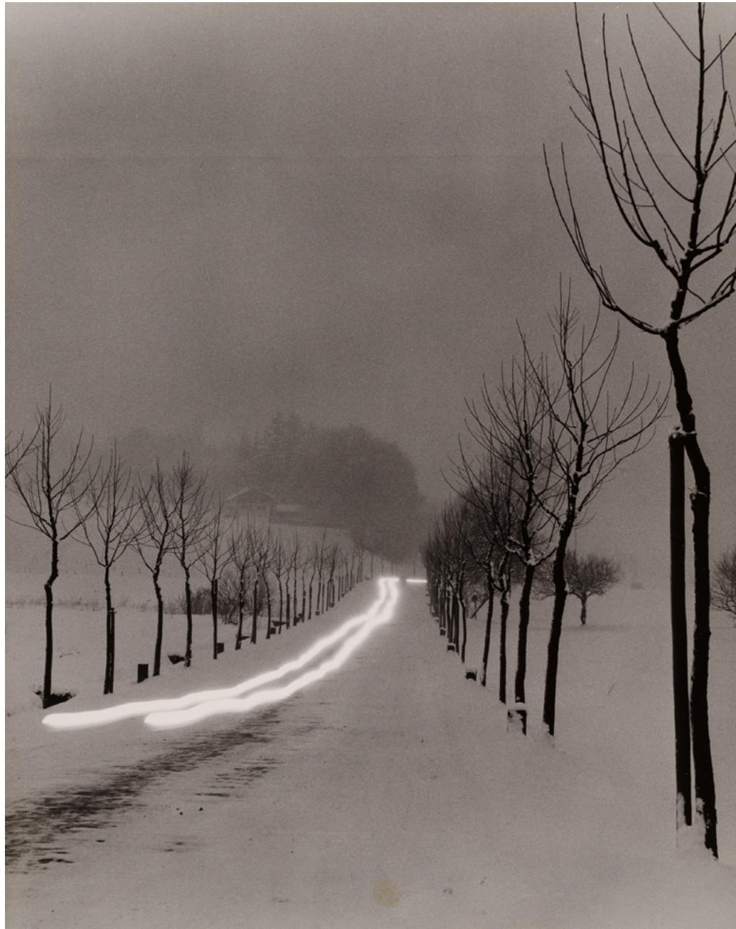
Peter Keetman (1916-2005): Winterliche Straße in der Dämmerung, Bernau 1956 Silbergelatineabzug, 36,2 x 28,9 cm