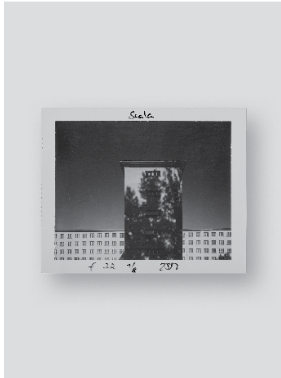
Seebad, Prora, 2002