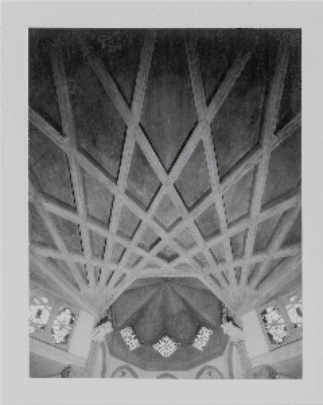
Sankt Mauritius, Köln, 1993