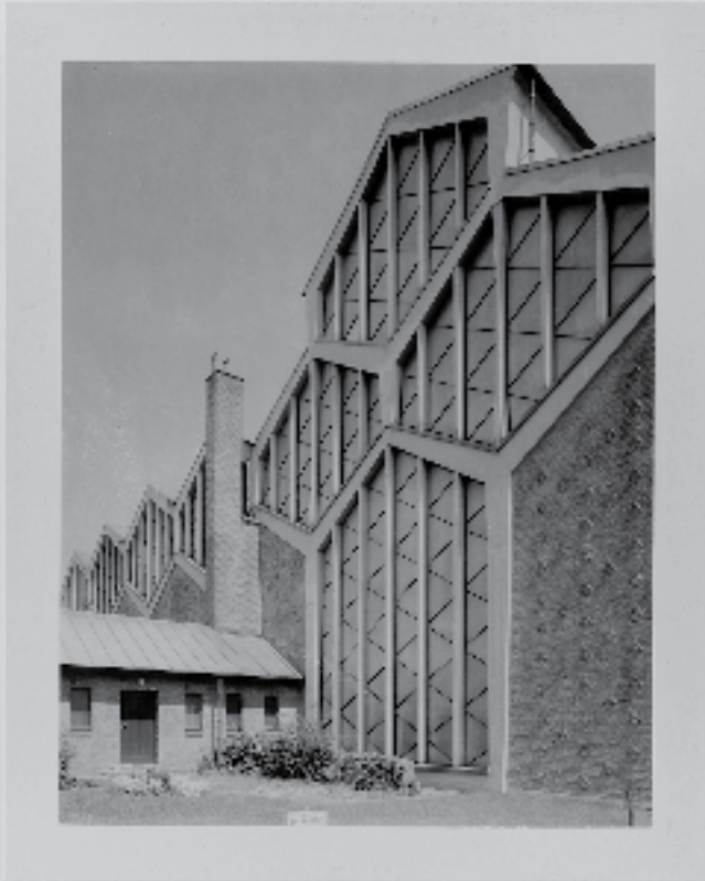
Sankt Josef, Köln, 1995