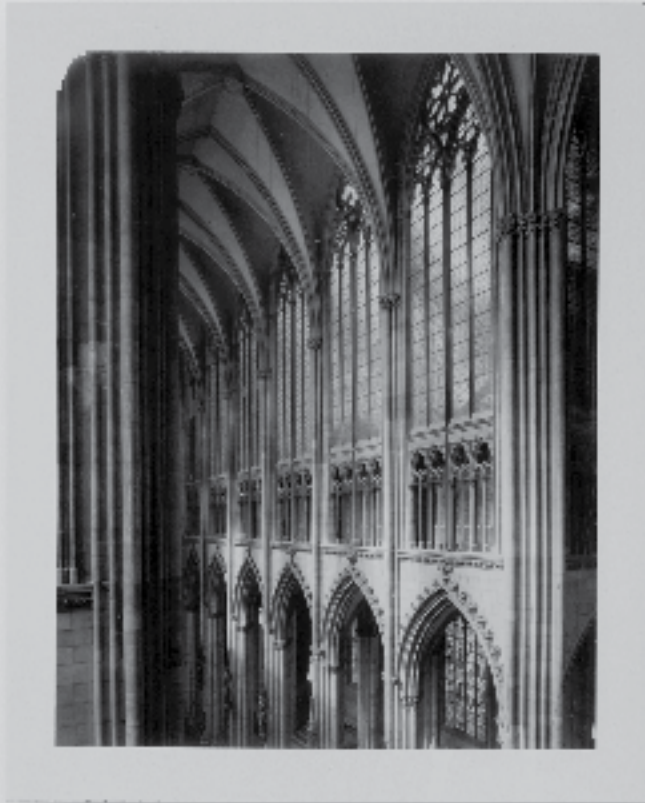
Sankt Petrus, Köln, 1996