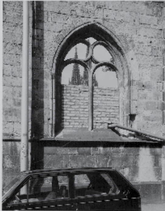
Sankt Kolumba, Köln, 1995